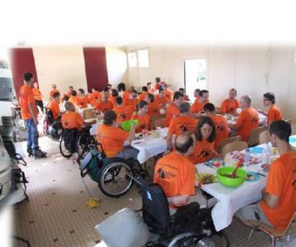
Les « roulants » & « logistiques » réunis