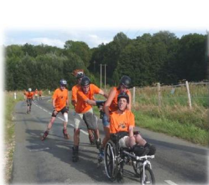
Les « roulants » : fauteuil et pousseurs

De handicaps zijn van verschillende aard (paraplegie, amputatie, degeneratieve ziekte ...). Er zijn ook mensen bij met "onzichtbare handicaps" (hersenletsel, doofheid, niertransplantatie, ...) die diverse rollen op zich nemen.