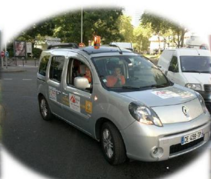
Les « logistiques » : voiture balai